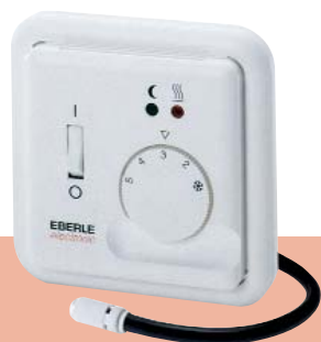
FRe 525 22/23