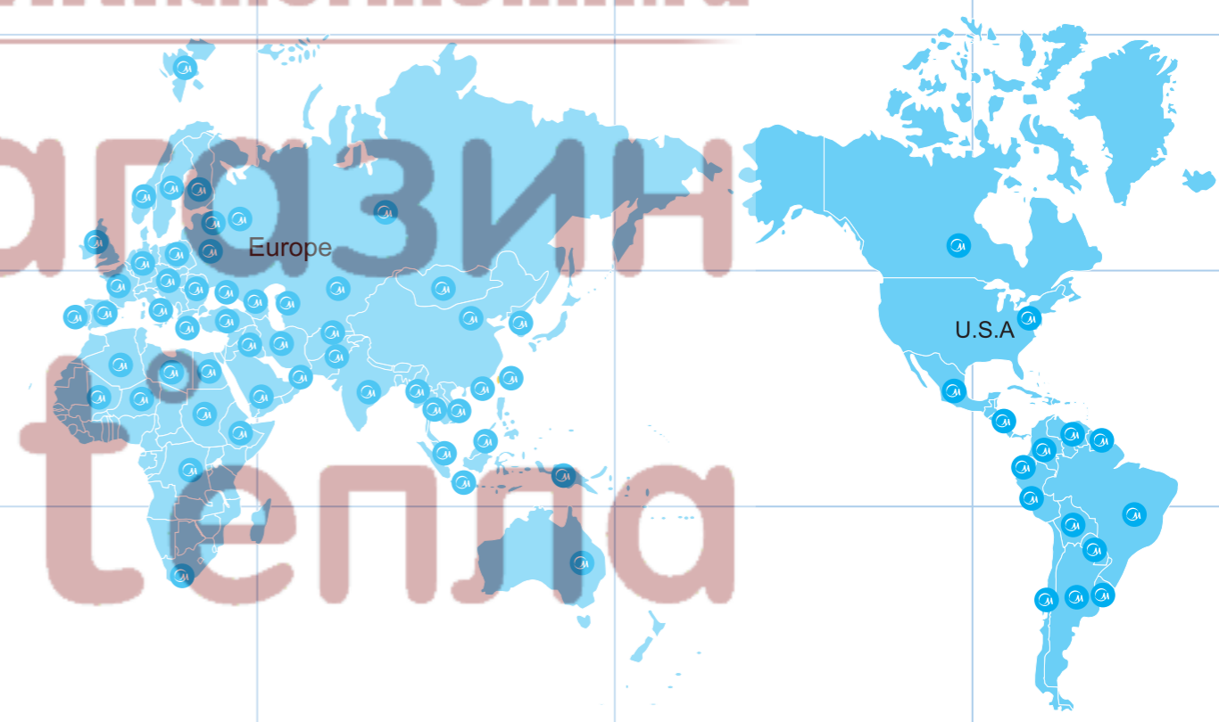
● Страны, где реализуются кондиционеры Midea

тел. +7 495 646-11-99; mail@thermomir.ru