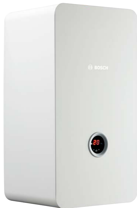
Tronic Heat 3000/3500