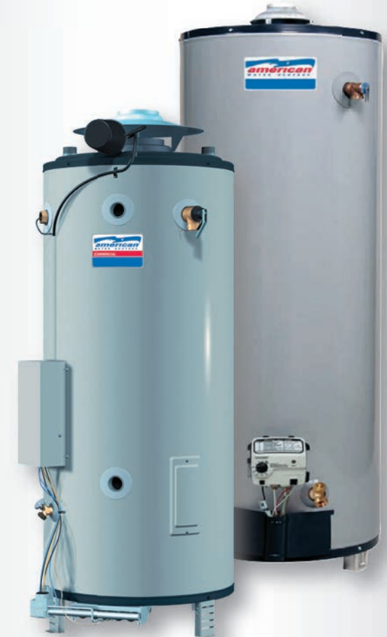
ГАЗОВЫЕ НАКОПИТЕЛЬНЫЕ ВОДОНАГРЕВАТЕЛИ С ОТКРЫТОЙ КАМЕРОЙ СГОРАНИЯ