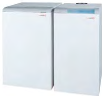
Совместная работа бойлера и котла МЕДВЕДЬ