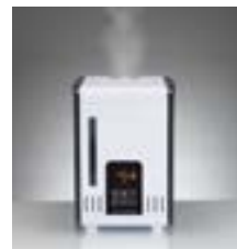
Пар на выходе не обжигает (+48°C +58°C, в зависимости от интенсивности увлажнения)