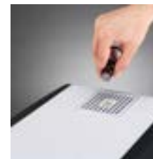
Увлажнитель оснащен функцией ароматизации