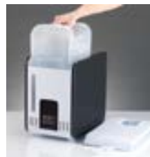
Удобная ручка для переноски бака