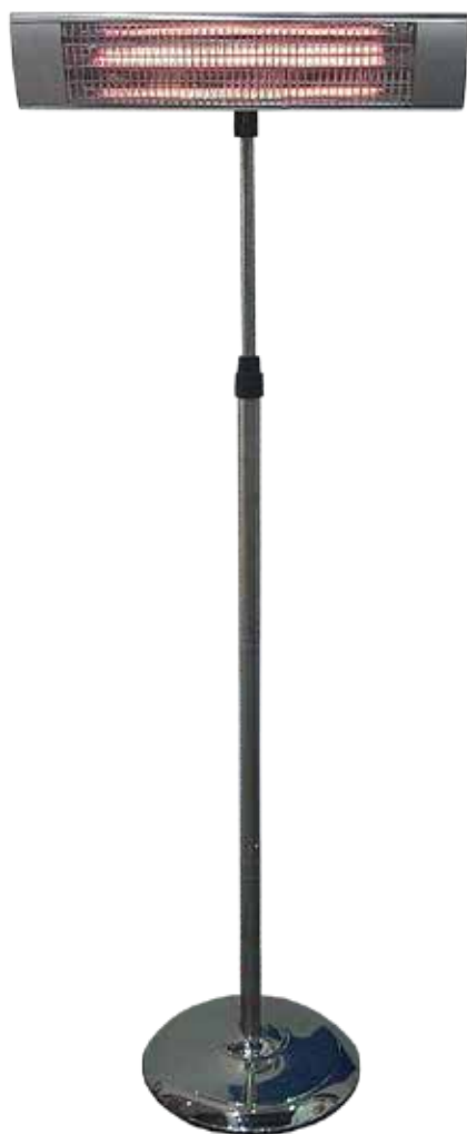
TIR HP1 1500 TIR HP1 1800