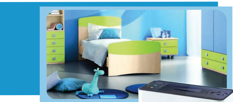
Увлажнитель воздуха ультразвуковой D-N40UFO