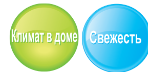
Увлажнитель воздуха ультразвуковой D-N50UCF-(W/B)