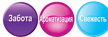
Увлажнитель воздуха ультразвуковой D-N50UN