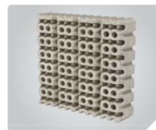
Высококачественная керамическая панель класса А

Обогреватель BIGH-55 — новейшая российская разработка для комбинированного обогрева