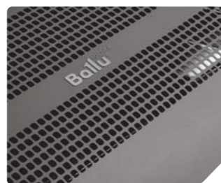
Передняя панель с перфорацией