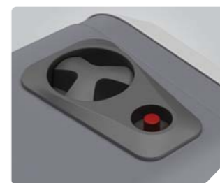
Панель управления эргономичная