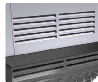
Передняя панель с перфорацией