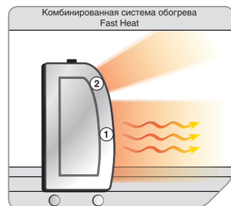
Тепло быстрее на 25% за счет комбинации инфракрасного и конвективного обогрева