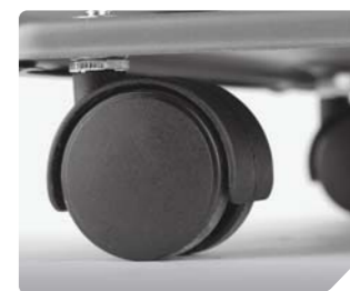
Усиленные колеса для перемещения обогревателя