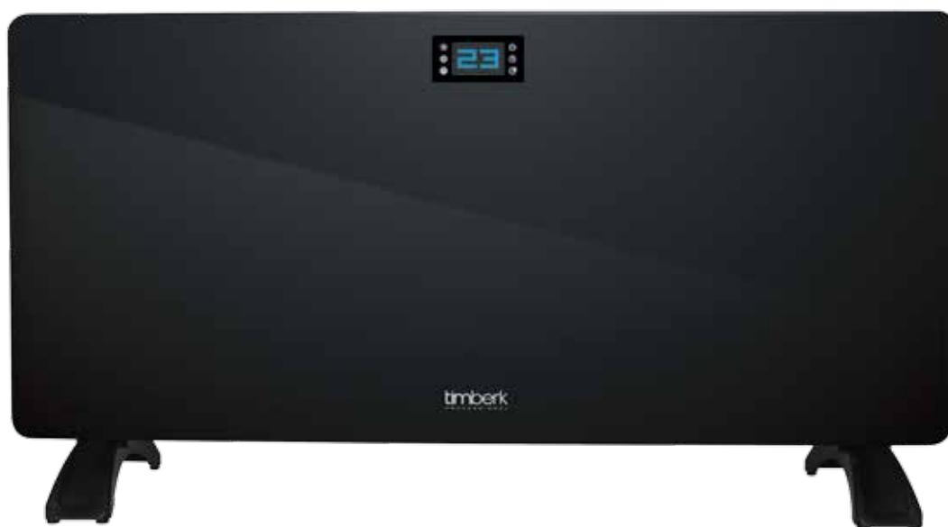
TEC.PF7 EL IN (AQ) - электронный термостат