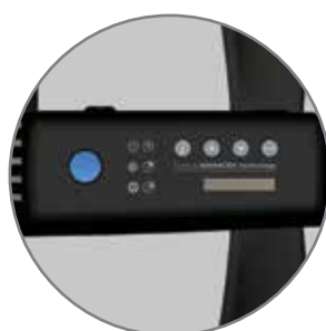
панель управления со специальным отсеком для пульта ДУ